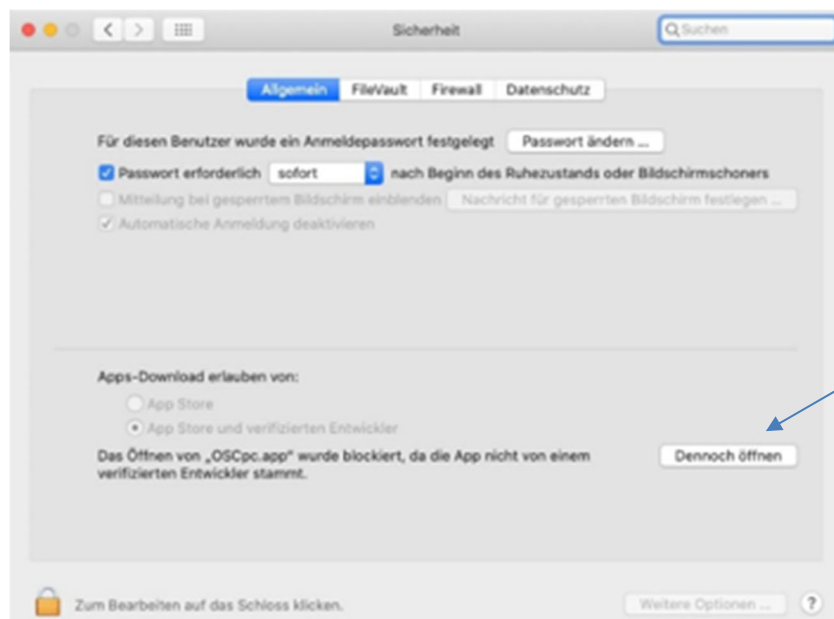
Abbildung 4 Fenster Sicherheit

In dem neu geöffneten Fenster Sicherheit (Abbildung 4) ist unter dem Reiter Allgemein der Button Dennoch öffnen zu klicken.