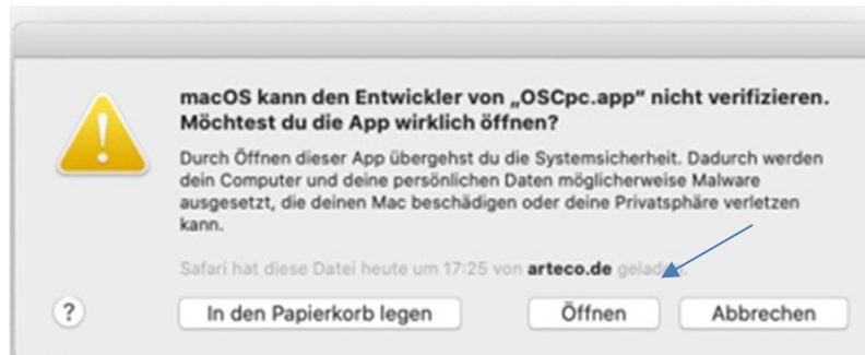
Abbildung 5 Bestätigung

Hierauf erscheint ein weiteres PopUp-Fenster (Abbildung 5), mit dem Sie die Installation der Datei OSCpc.app durch einen Klick auf den Button Öffnen starten.