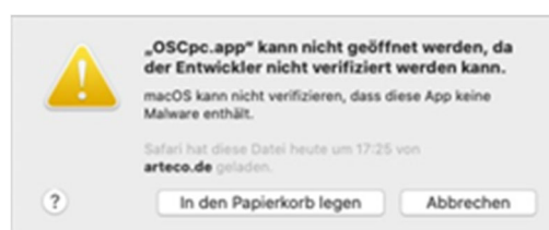
Abbildung 2 Sicherheitshinweis

Klicken Sie über den Finder die Datei OSCpc.app mit der rechten Maustaste an (kein Doppelklick) und wählen aus dem sich neu angezeigten Menü Öffnen aus. Es wird nun folgendes PopUp-Fenster (Abbildung 2) angezeigt. Bei diesem klicken Sie bitte auf Abbrechen .